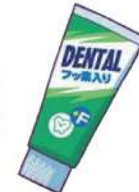
フッ素入り歯磨き剤