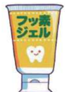
フッ素入りジェル