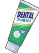
フッ素入り歯磨き剤